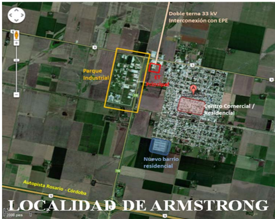
Ilustración 3: Proyecto piloto en la localidad de Armstrong, Provincia de Santa Fe