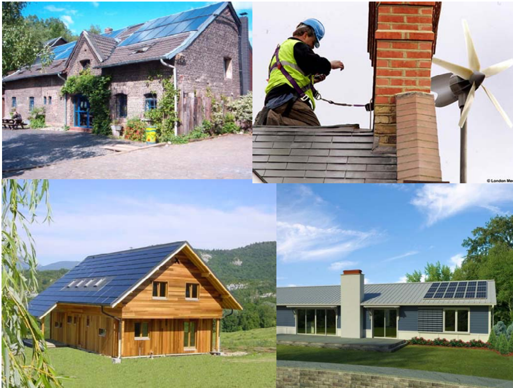
Ilustración 2: Micro-generación de paneles solares y pequeños eólicos

Tecnología, los distintos Institutos de Tecnología locales como el INTI y también las Universidades Nacionales. Asimismo, con el desarrollo de las redes inteligentes se crearían más y mejores puestos de trabajo altamente calificados.